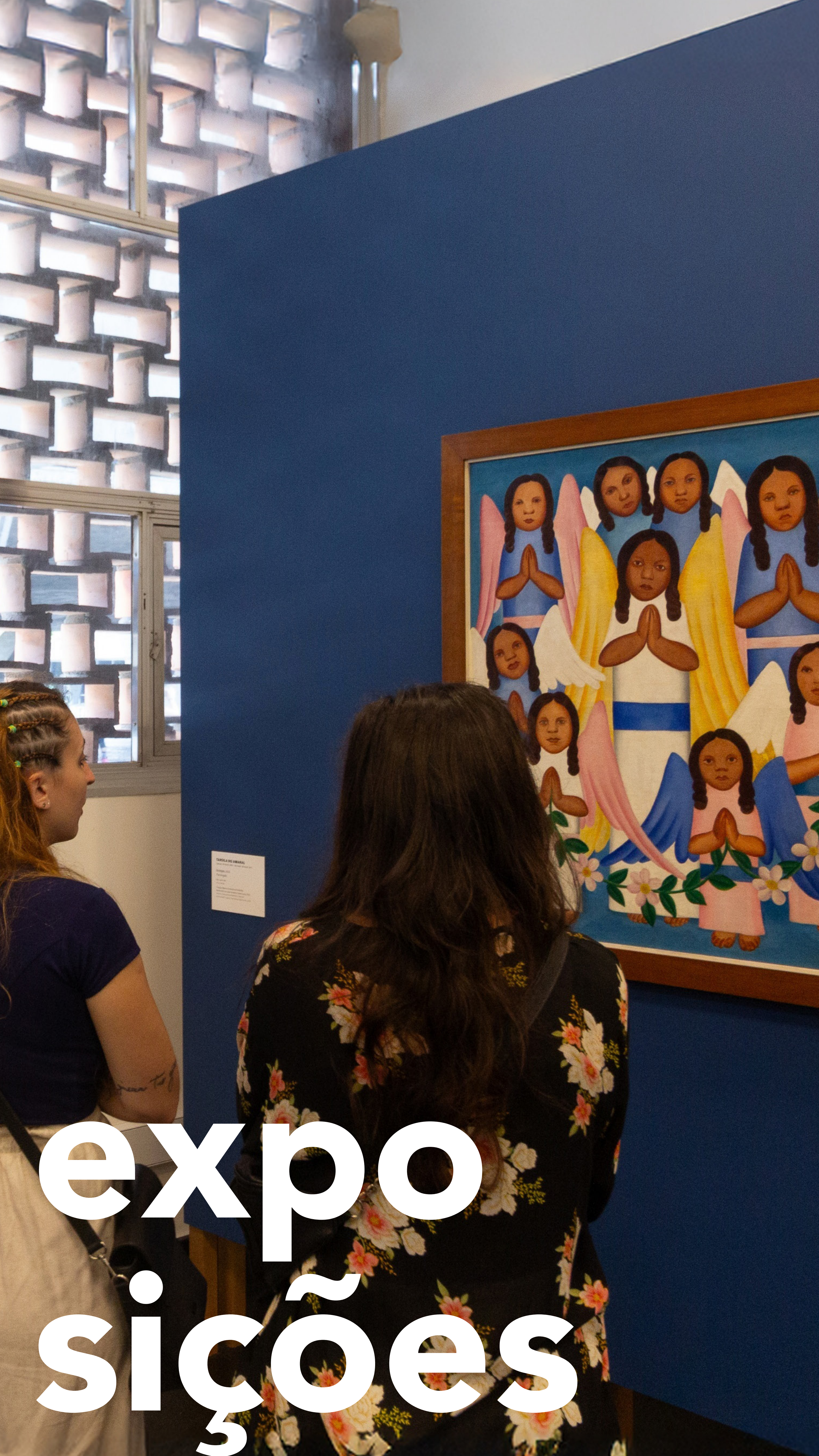
TAVOLA DO AMARAL Século XVIII Brasil Óleo sobre tela 150 x 100 cm Museu de Arte de São Paulo Fundação de Arte Moderna